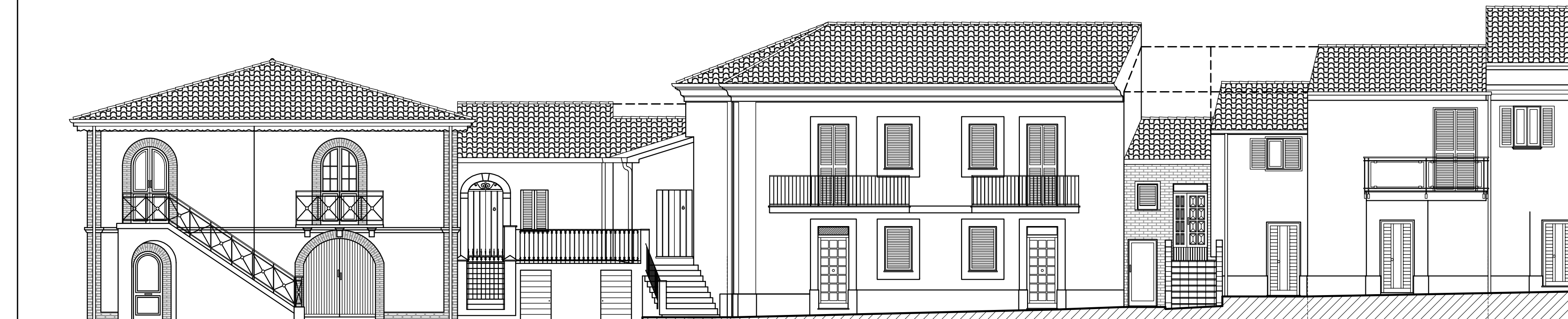
81 82 83 85 88 PROSPETTO NORD SU PIAZZA MACELLO