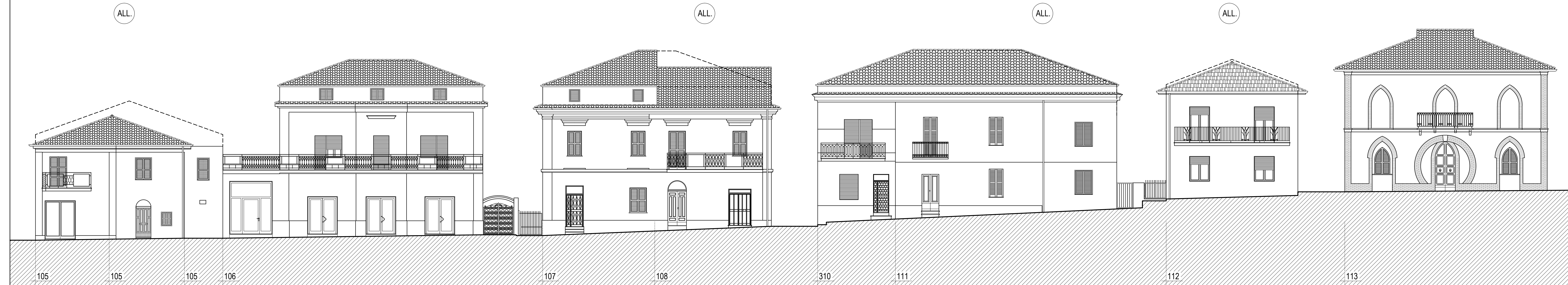
PROSPETTO NORD SU VIA VITTORIO EMANUELE II